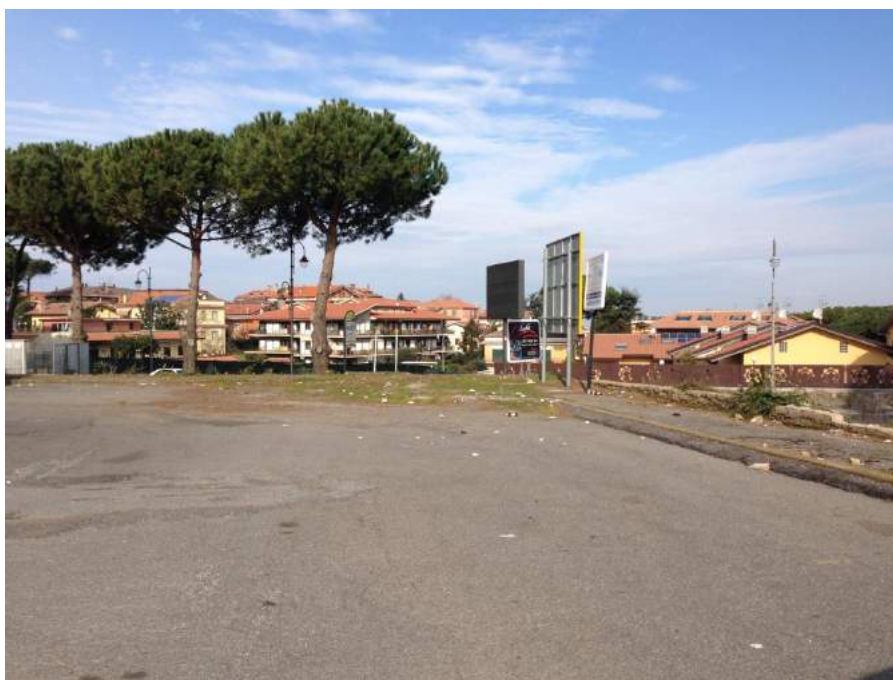
FOTO 2 AREA CHIOSCO C_13