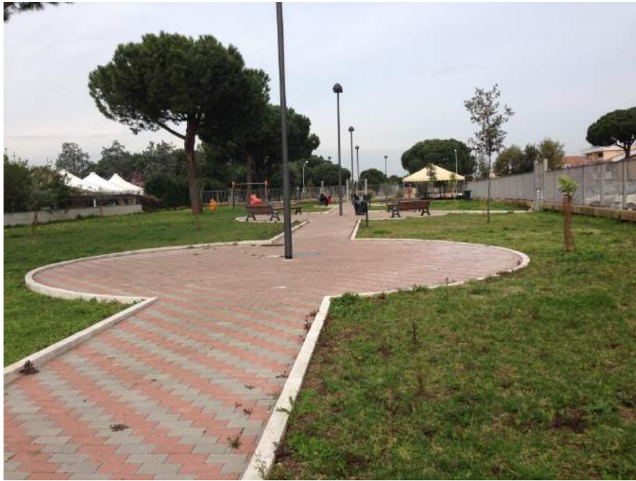
FOTO 3 AREA CHIOSCO C_01