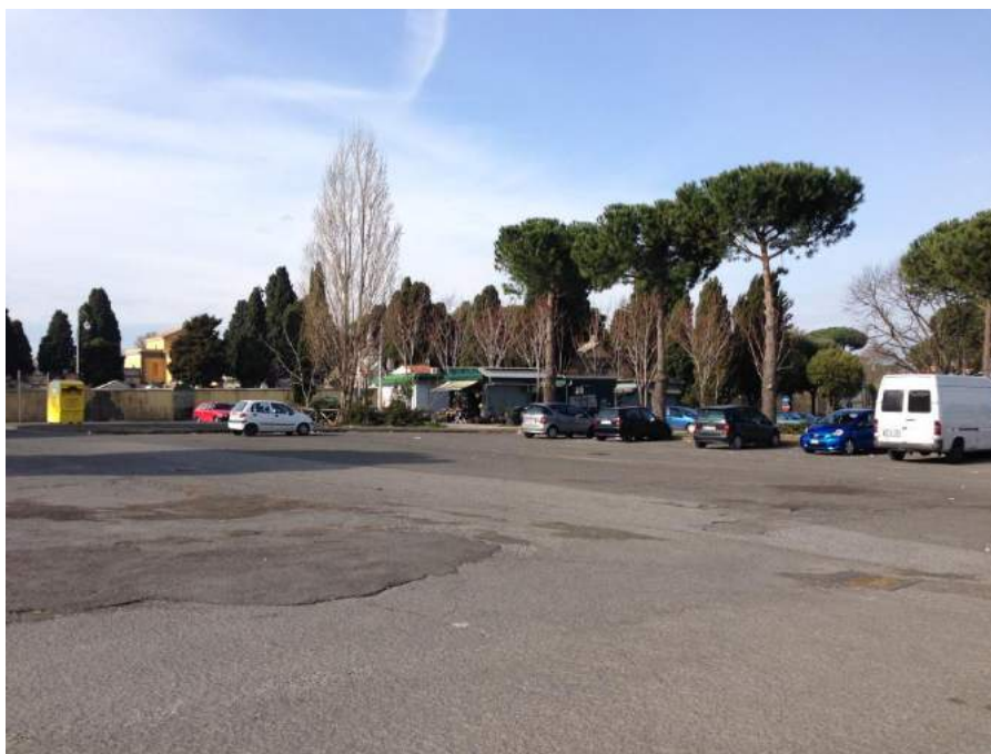
FOTO 1 AREA CHIOSCO C_13