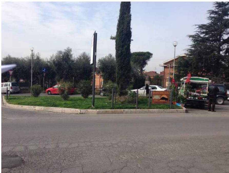
FOTO 1 AREA CHIOSCO C_06